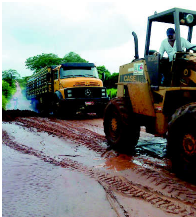
Caminhões precisaram ser arrastados para passar pela Estrada Municipal Jales-Paranapuá

A chuva que tem caído nestes últimos dias, tem castigado toda a região. Na tarde de quinta-feira, 10, a chuva torrencial que caiu sobre Fernandópolis alagou casas e interrompeu o tráfego na principal rodovia da região, a Euclides da Cunha (SP-320). Segundo a imprensa da vizinha cidade, a água chegou a cerca de 2 metros e causou um congestionamento de quatro quilômetros, dos lados do alagamento, no sentido Votuporanga a Jales e vice-versa.