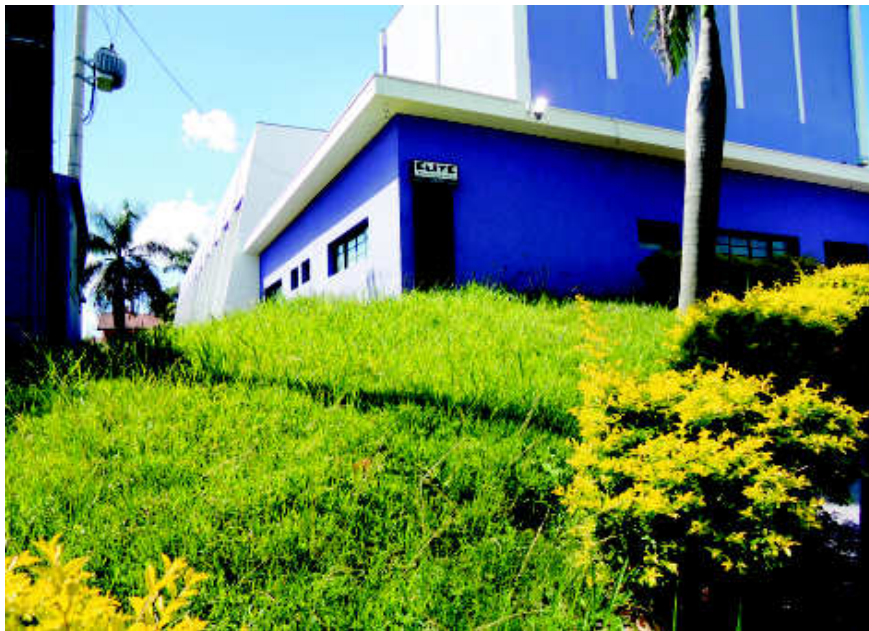
Porta da sala onde a Elite vem utilizando no Centro Cultural Edílio Ridolfo