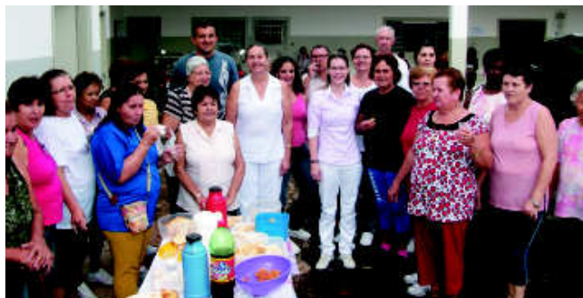
Um café da manhã foi servido para todos os participantes

À tarde, além da palestra houve o tradicional bingo só para mulheres, onde funcionárias e usuárias da unidade se divertiram com as marchinhas