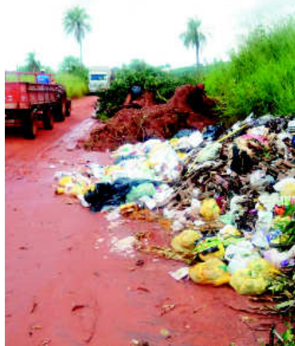
Até lixo doméstico está sendo despejado no local