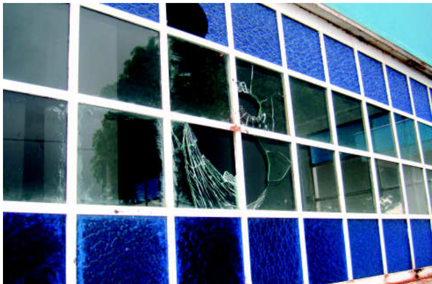
Um dos alvos dos arruaqueiros foram as vidraças da secretaria do Clube do Ipê