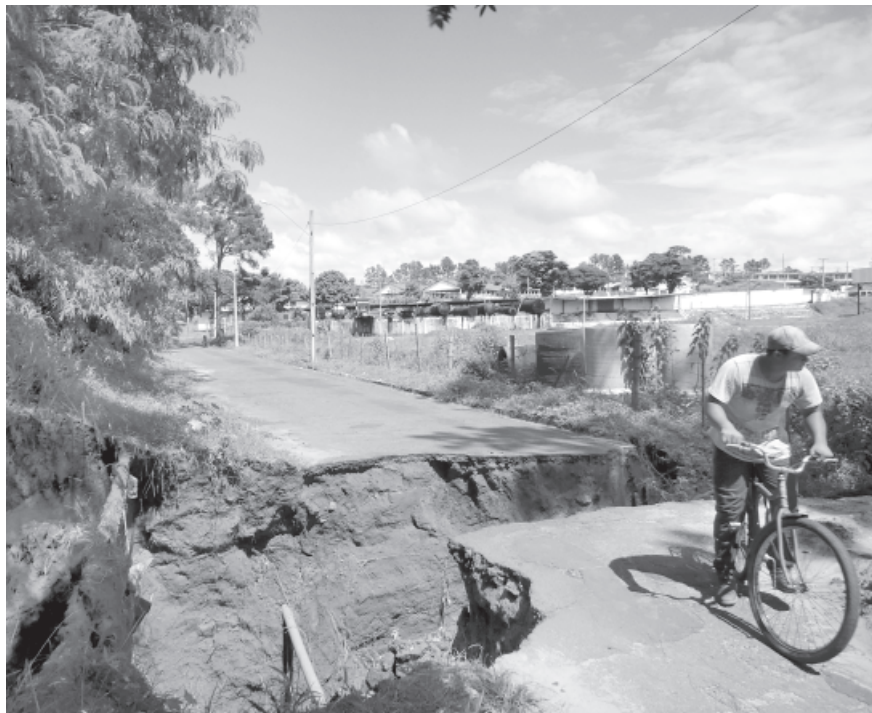
A rua foi cortada pela cratera que surgiu depois das chuvas