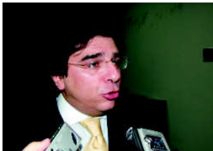
D'Urso: "A procuradoria não tem poderes para intervir na relação entre advogado e cliente"

A diretoria da OAB – Jales protocolou duas queixas contra o procurador ao Conselho do Ministério Público. Uma delas foi arquivada e a outra ainda está em andamento. (A.R.)