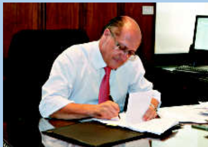
Alckmin assina o decreto de desapropriação de áreas nas margens da Rodovia Euclides da Cunha

A duplicação da Rodovia Euclides da Cunha receberá investimento de R$ 774 mi-