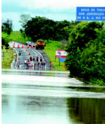
O rio São José dos Dourados transbordou e invadiu a pista perto de Pontalinda