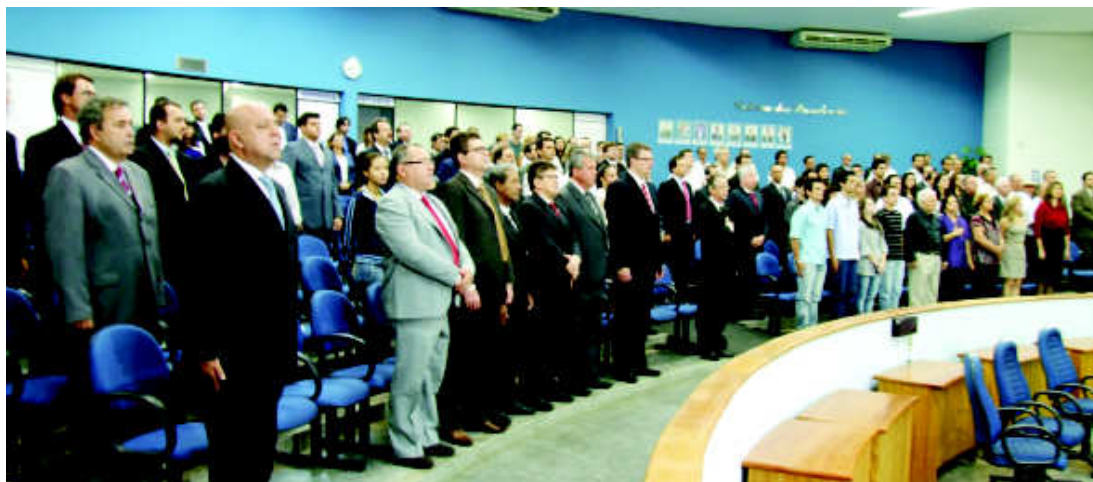
A Câmara Municipal recebeu representantes de quase 20 subseções da Ordem dos Advogados do Brasil no desagravo contra o procurador da república

Ética da Ordem, disse que a situação de Jales "é típica de quem não consegue compreender o papel social do advogado."