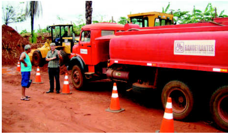
Consórcio Bandeirantes já instalou canteiro de obras em Santa Fé do Sul